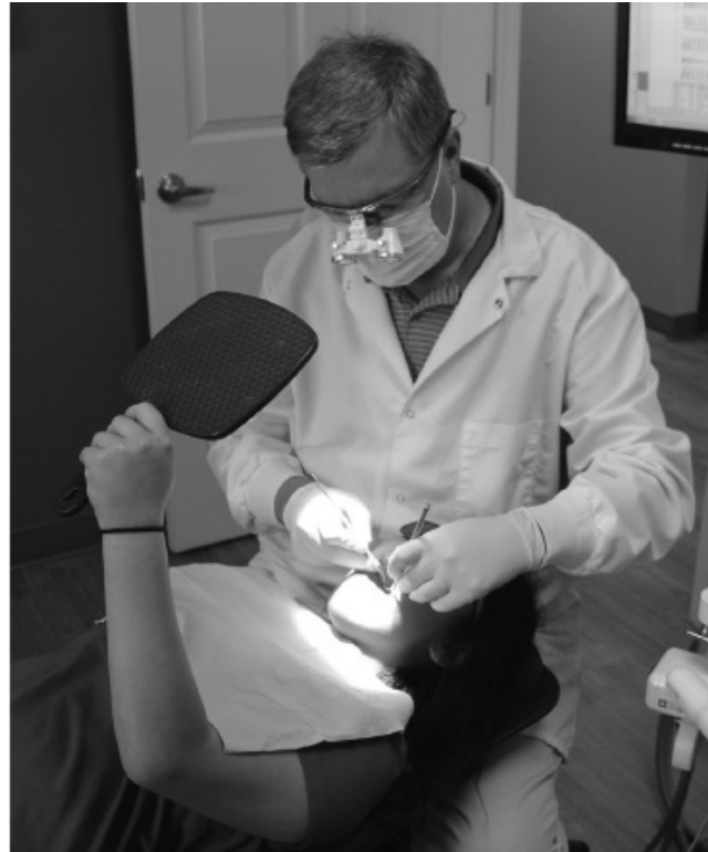
شکل ۳-۱۷ کودک پروسه‌ی داخل دهانی را با آینه دستی مشاهده می‌کند. اگر آینه مانع تابش نور به حفره دهان شود، از آینه کوچکتری استفاده می‌شود. با استفاده از هندپیس‌های فایبراپتیک، مشکل جلوگیری از تابش نور وجود ندارد.

۷- نسبت به رفتار نامناسب جزئی، بی توجه باشید. نادیده گرفتن بدر رفتاری‌های جزئی، در صورتی که تقویت نشود، باعث فرونشاندن رفتار نامناسب می‌شود.